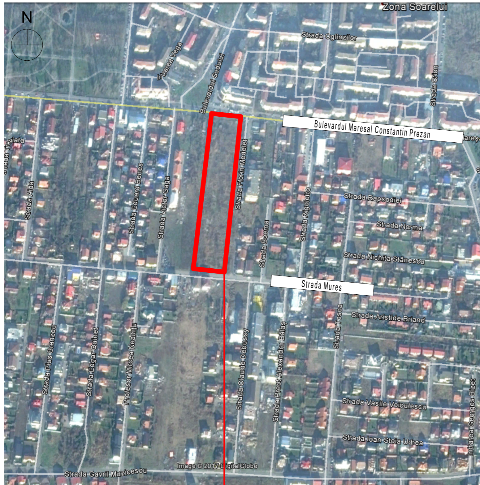
Google Earth - 2016